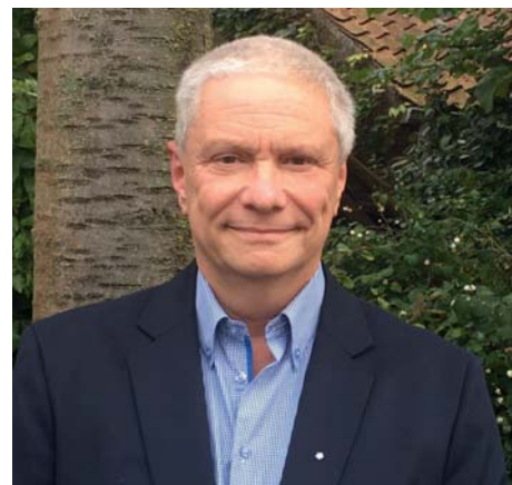
"We verwachten dit jaar meer Nederlandse bezoekers."

Op Prowood worden veel live demonstraties gehouden en er vindt een uitgebreid programma plaats van randactiviteiten zoals artisanale houtdemo's, lezingen en het tentoonstellen van houtsculpturen. Het beleevingsgehalte van de beurs is dus hoog en potentiële klanten kunnen zich een goed beeld vormen van producten. Claesens: "Bijna alle houtbewerkingsmachines functioneren tijdens de beurs. Bovendien koop je niet zomaar even hele grote installaties via internet: hier is een verkennend gesprek voor nodig, gevolgd door een situationele analyse van de doelstellingen. Pas dan kom je tot een goed en langdurig resultaat." Prowood vindt om de drie jaar plaats. Voor die frequentie is niet voor niks gekozen, legt de directeur van Claever Associates uit. "Sommige stands hebben om en nabij 1.000 vierkante meters netto oppervlakte. Machines nemen