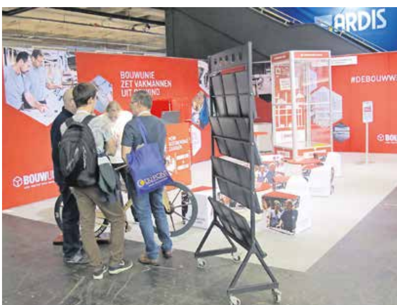
Bouwunie organiseerde onder meer infosessies rond de EPB- en EBA-regeling.